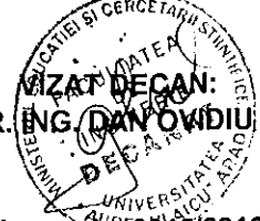
Tabel nominal cu studenții Facultății de Inginerie care beneficiază de bursă pe sem I an univ. 2015/2016 pentru programele de studii de LICENȚĂ